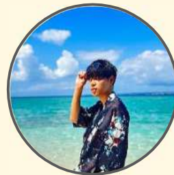
慶應大学 経済学部 ゆうさくPT

大学生活のことなど、モチベーションが上がる話をたくさんできるのでぜひ聞いてください、最後まで一緒に走り切りましょう！