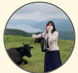
島根大学 医学部医学科 かなごんPT

大学生活のことなど、モチベーションが上がる話をたくさんできるのでぜひ聞いてください、最後まで一緒に走り切りましょう！